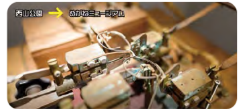
西山公園 → めがねミュージアム

次にめがねミュージアムを訪れ、めがねの歴史を見学し、めがねShopでは大変きれいで心ひかれるフレームが多数ありました。