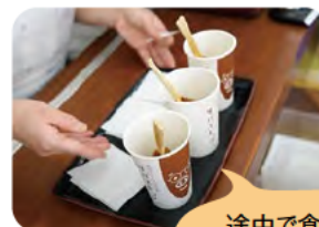
途中で食べたご当地 B級グルメの「サバエドッグ」

この鯖江の地で、鯖江歩兵第三十六連隊衛戍病院時代から続く公立丹南病院を、より一層良くしていくよう努力していきたいと考えておりますので、今後ともよろしくお願いたします。