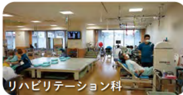
リハビリテーション科