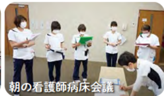
朝の看護師病床会議