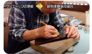
河和田の漆器 → 河和田漆器協同組合

さらに河和田の漆器協同組合にお邪魔し、実際に彫りをされている方にお話をうかがいながら見学させていただきました。1人前になるまで5年程度はかかるということと、早いものであれば1日程度で完成するという速さにも驚きました。